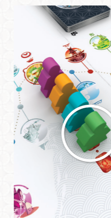
Зелений мандрівник першим покидатиме рьокан.

Мандрівник, який першим прибуває до рьокану, бере стільки карт страв, скільки є гравців, плюс 1. (Наприклад, у грі в трьох він бере 4 карти).