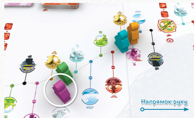
Фіолетовий мандрівник перебуває позаду зеленого мандрівника, тому хід переходить до нього.