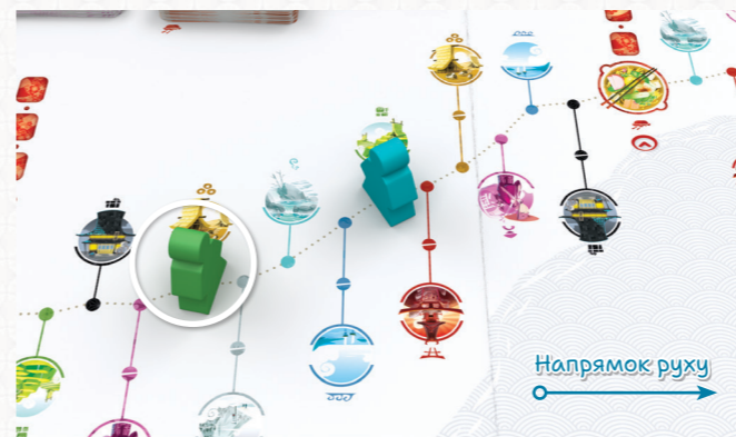
Зелений мандрівник — останній, тому хід переходить до нього.

Якщо після завершення ходу гравця його мандрівник залишається останнім, то він ходить ще раз.